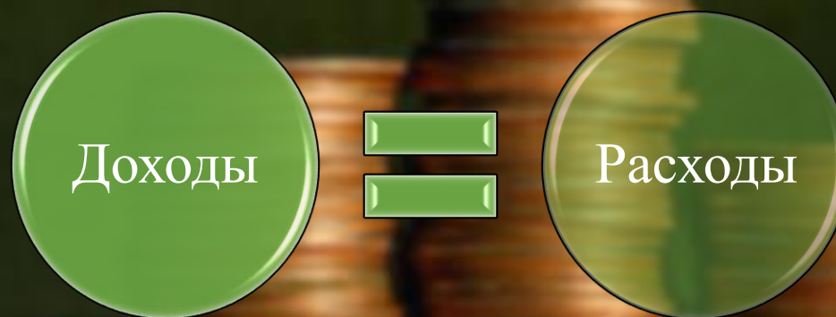
Рис. 1 «Эффективный бюджет = сбалансированный бюджет»

Для начала необходимо показать, что такое «сбалансированный бюджет» (рисунок 1) – это тот бюджет, при котором достигается равновесие между доходами и расходами.