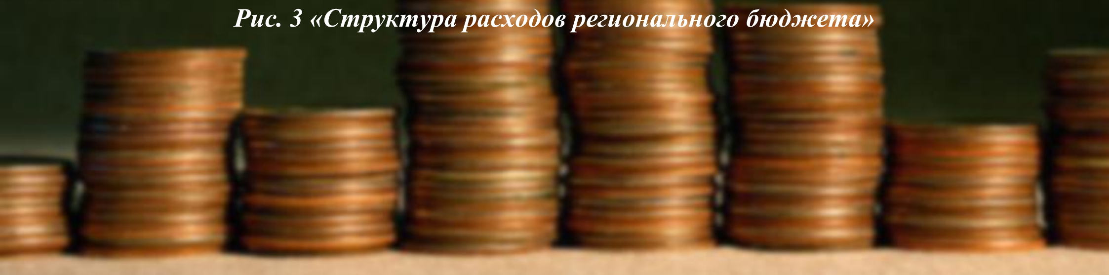
Рис. 3 «Структура расходов регионального бюджета»