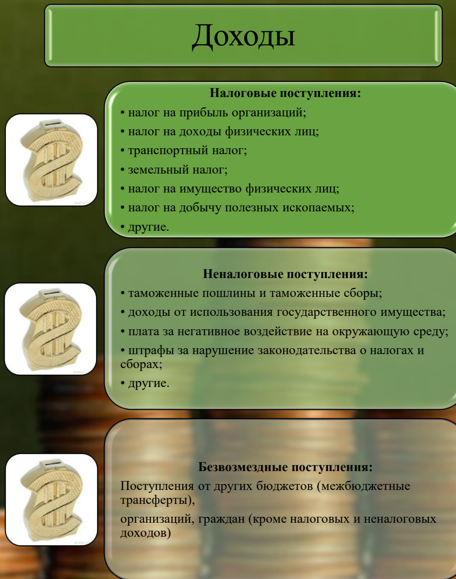
Рис. 2 «Структура доходов регионального бюджета»

Рассмотрим из структуры на рисунках 2 и 3.